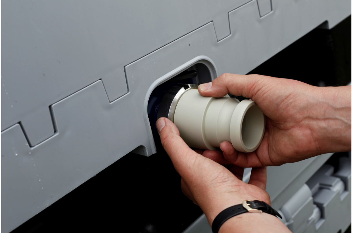
Adapter Typ 1. Skruvas fast med en metallring.