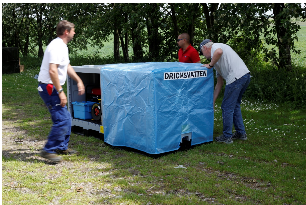
Skyddshuv på plats. Bilden visar skyddshuven som finns i sommarscontainern.